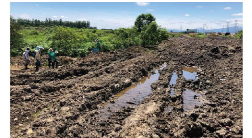
埋め立てられる福移湿原