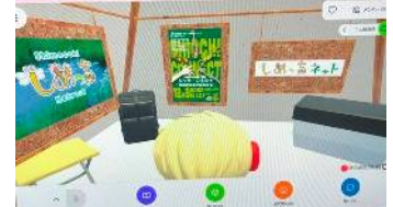
湿地 VR とブースのイメージ